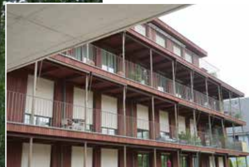
Das Ortsbürgerhaus ist bewohnt