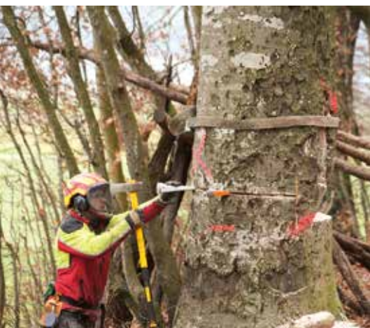
Präzis berechnete Baumfällung