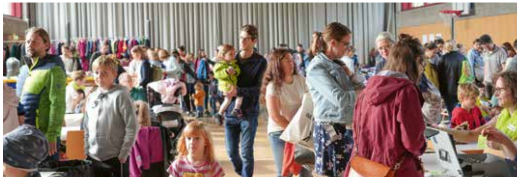
Begegnen, Einkaufen, Geniessen – Staufen stimmt sich an der Börse auf den Frühling ein

Auf dem Vorplatz der Turnhalle findet gleichzeitig der beliebte Spielwarenflohmärkt statt. Die Kinder dürfen auf einer Decke ihre Spielsachen präsentieren, verkaufen oder tauschen. Unser aufmerksames Börsenkafiteam verwöhnt euch drinnen mit Getränken,