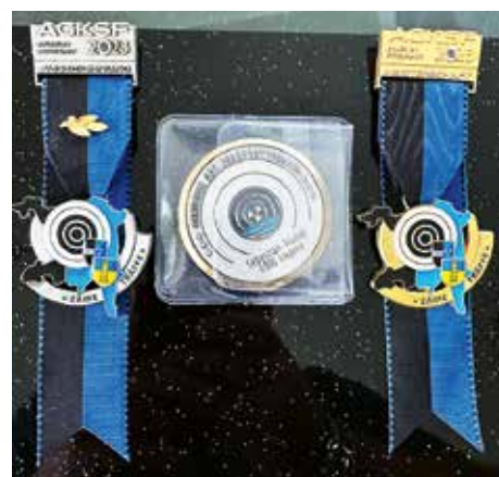
Die begehrten Auszeichnungen

Staufner-Resultat den guten 23. Schlussrang von 340 qualifizierten Schützen. Weitere Resultate sind im Internet zu finden.