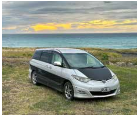
Mit unserem Auto kamen wir in jede Parklücke und hatten trotzdem unser eigenes Bett dabei

Der Start und das Ende unserer Reise war auf der Nordinsel in Auckland. In diesem Teil Neuseelands begeisterten uns vor allem die verschiedenen Vulkane. Sie beeinflussen ihre direkte Umgebung sehr stark und lassen wunderschöne Gegenden entstehen.