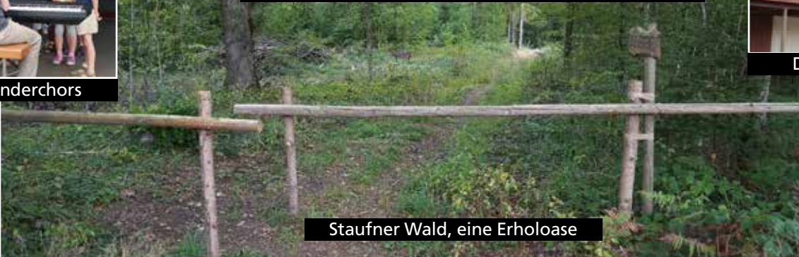
Staufner Wald, eine Erholoase