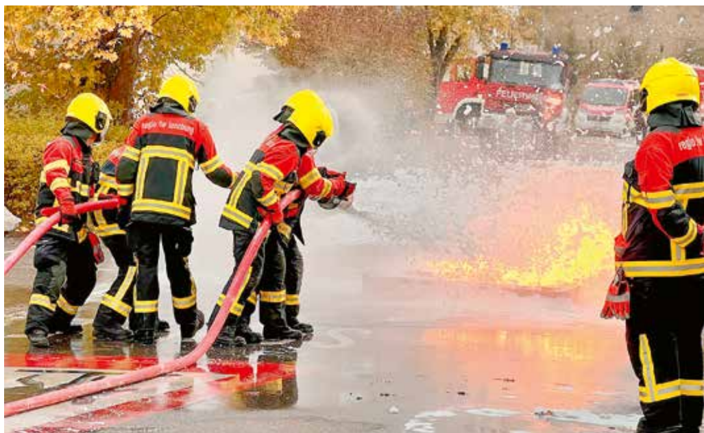
Schaum statt Wasser

Ihm und seinem engagierten und mutigen Team ein riesiges Dankeschön für den unermüdlichen und wertvollen Einsatz heute. Und jeden Tag!