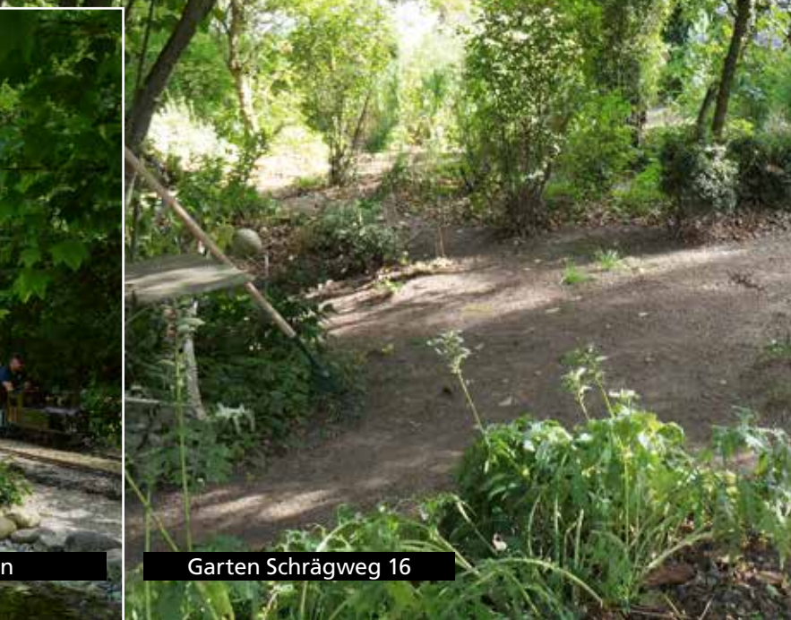
Garten Schrägweg 16