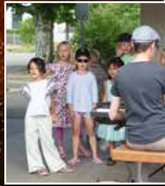
Konzert des Ki