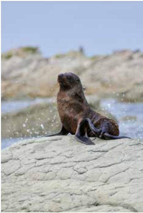
Der junge Seelöwe posierte für uns auf einem Stein