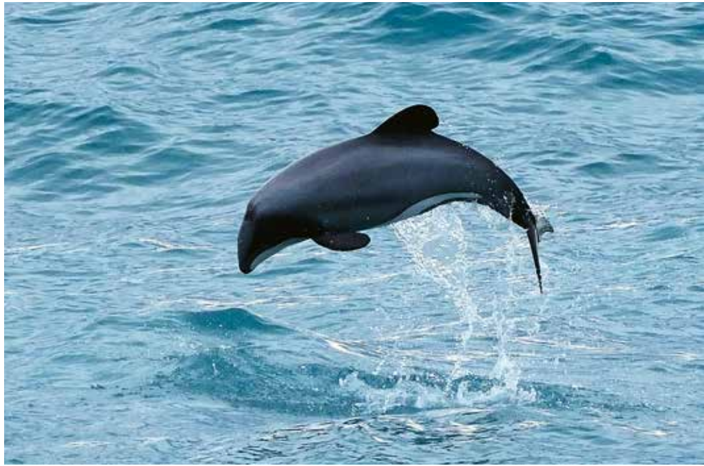
Hector Delfine gehören zu den kleinsten Delfinarten der Welt

mal aber bewegen sie sich an Land fort oder gehen ins Wasser schwimmen. Besonders unterhaltsam ist es auch mitzuverfolgen, wenn sie sich streiten. Neben vielen hundert Seelöwen hatten wir auch das Glück Delfine zu sehen. Einen konnten wir vom Strand aus beobachten, wie er nur rund 100 Meter von der Küste entfernt hin und her schwamm und Sprünge machte. Zu den Highlights unserer Reise zählten aber definitiv die Whale Watching Tour, bei der wir einen Pottwal beobachten konnten. Vor der Küste in Kaikoura sind das ganze Jahr über Wale anzutreffen und dies wollten wir uns nicht entgehen lassen. Auf der zweistündigen Tour hatten wir das Glück den einen Pottwal sogar zwei Mal beob-