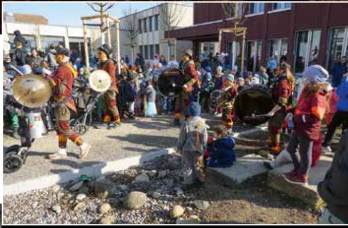
Fasnacht im Kindergarten