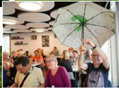
Bingo im Mahlwerk