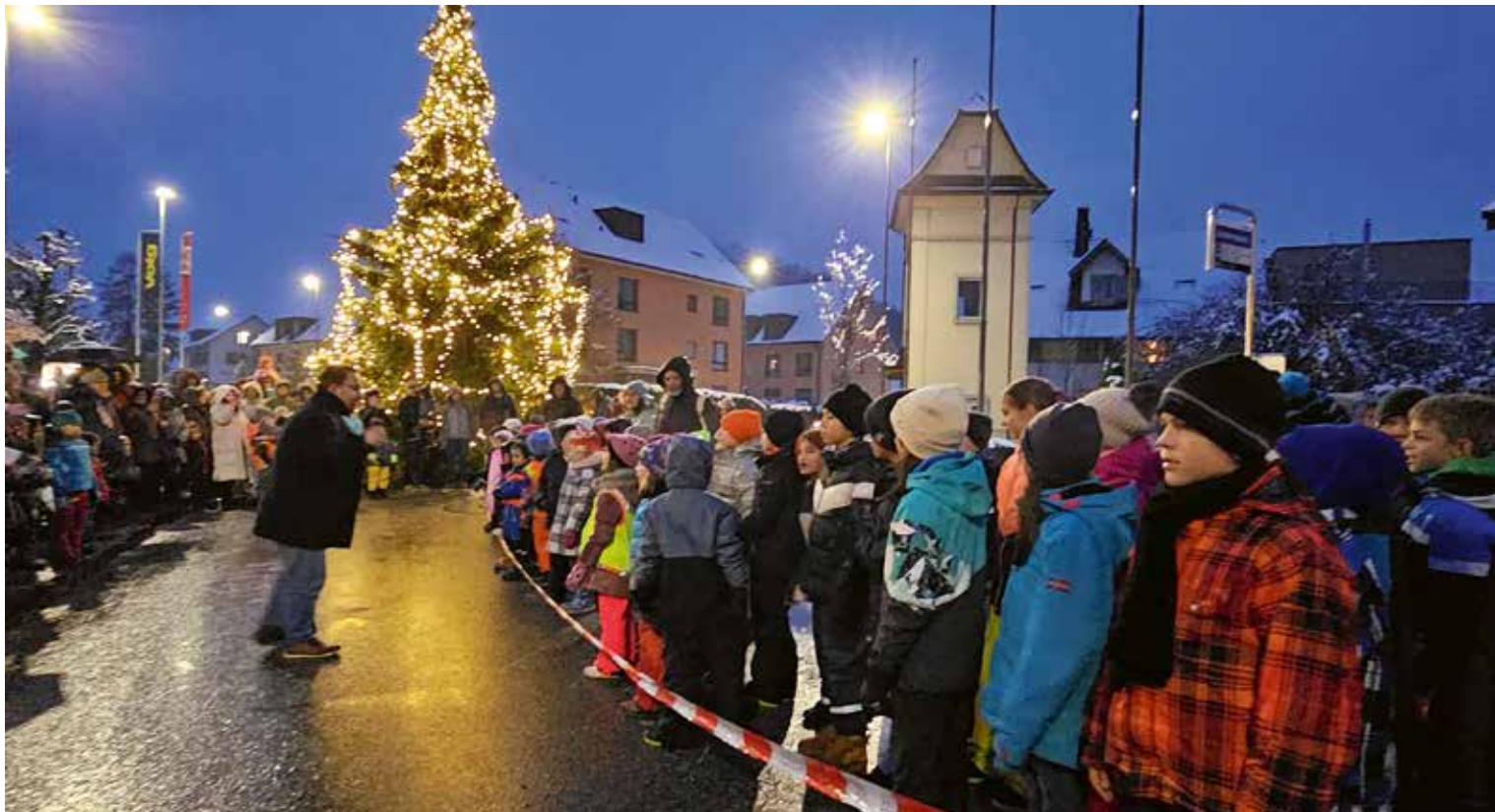
Singen beim Weihnachtsbaum