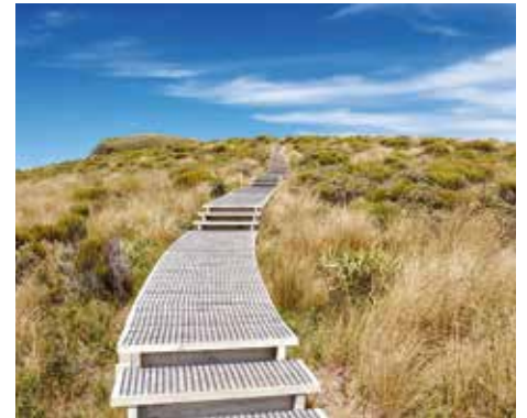
Die neuseeländischen Wanderwege sind sehr komfortabel

Erkundet haben wir die meisten davon bei Wanderungen. Die neuseeländischen Wanderwege sind nicht mit denen in der Schweiz vergleichbar. Es gibt sehr viele Wanderwege, aber es ist schwierig gute Wanderungen zu finden, da es keine zentrale Informationsseite dazu gibt. Ist aber eine schöne Wanderung gefunden, wird man verwöhnt. Selten kämpften wir mit unwegsamem Gelände, denn die Wege sind sehr gut präpariert. So absolvierten wir die gesamten rund sieben Kilometer zu den Pouakai Tarns, die eine sensationelle Sicht auf den Mount Taranaki bieten, auf Holzstegen. Steile Wege gibt es kaum, die meisten Höhenmeter überwinden wir mit Stufen! Auch bei der kurzen Wande-