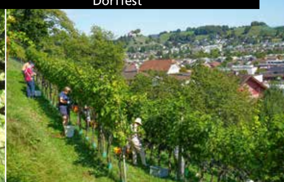
Leset am Staufberg