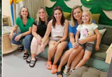
Neue Tagesstruktur in Staufen