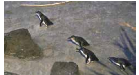
Die Little Blue Penguins wiegen nur knapp ein Kilogramm

achten zu können. Besonders der Moment, wenn der Wal abtaucht, ist sehr eindrucksvoll. Aber auch die Pinguine, welche wir beobachten konnten, als sie spät abends von ihrem täglichen Ausflug auf das Meer zurückkehrten, war ein grossartiges Erlebnis. Es war schon dunkel und nur dank der Strassenlampe erkannten wir etwas, als die kleinsten Pinguine der Welt, die Little Blue Penguins, über den Strand zu ihren Nestern watschelten. Zum Glück hatten sie es nicht so eilig, so dass wir genügend Zeit und Möglichkeiten hatten die nur 35 bis 40 Zentimeter grossen Pinguine zu beobachten.